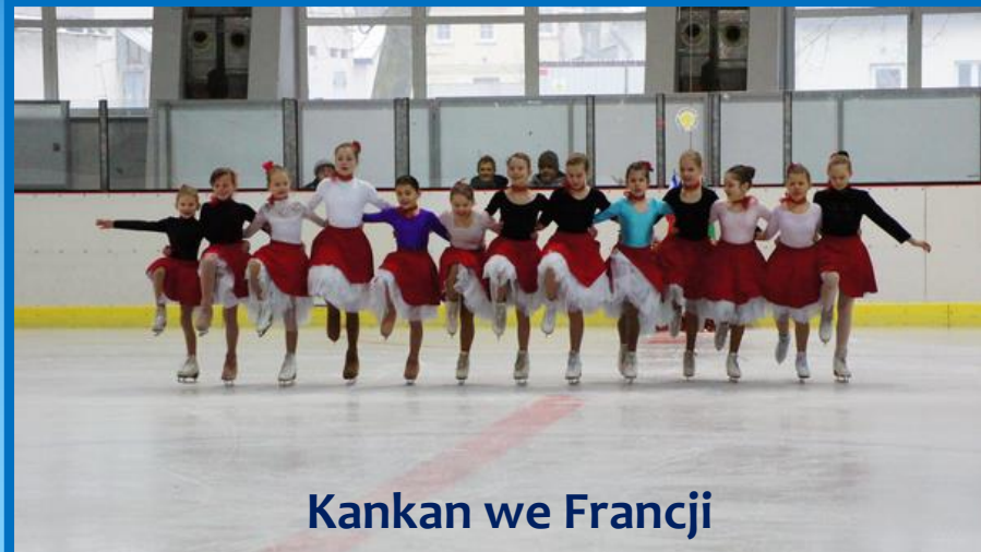
Kankan we Francji