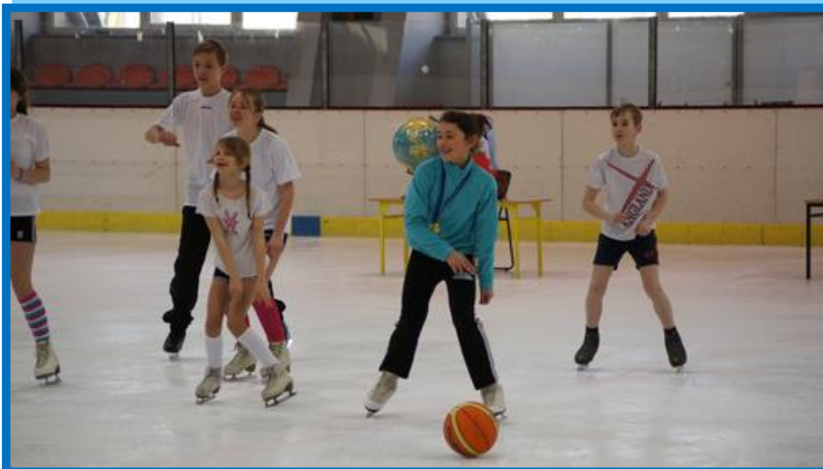
Lekcja wychowania fizycznego