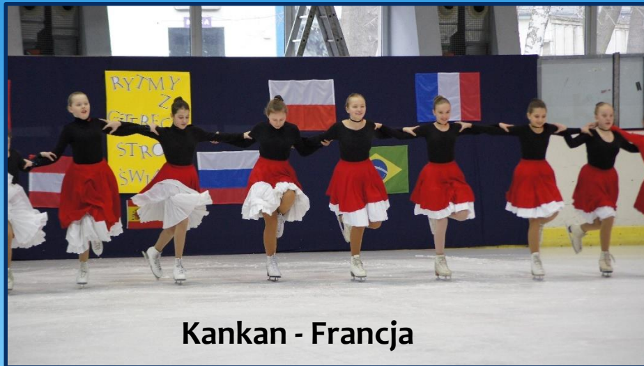
Kankan - Francja