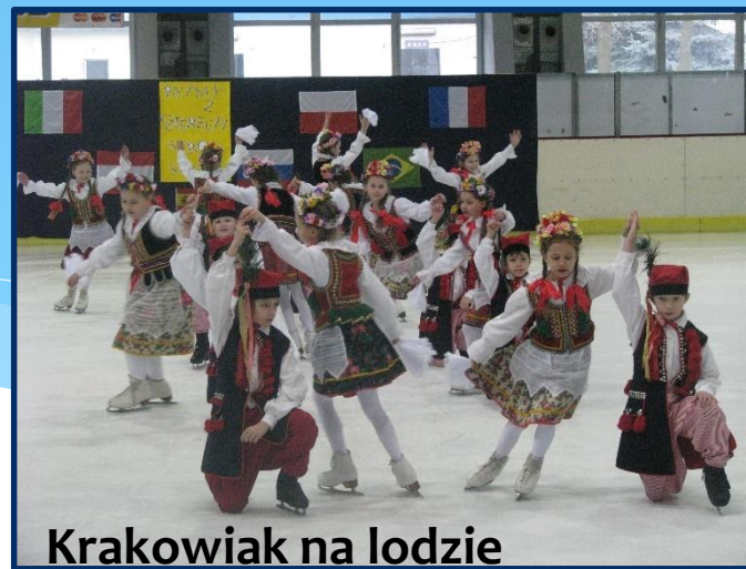
Krakowiak na lodzie