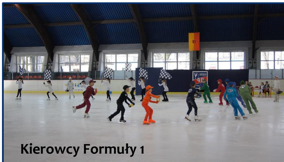
Kierowcy Formuły 1