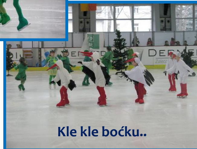
Kle kle boćku..