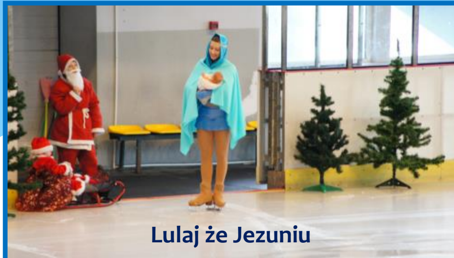
Lulaj ze Jezuniu