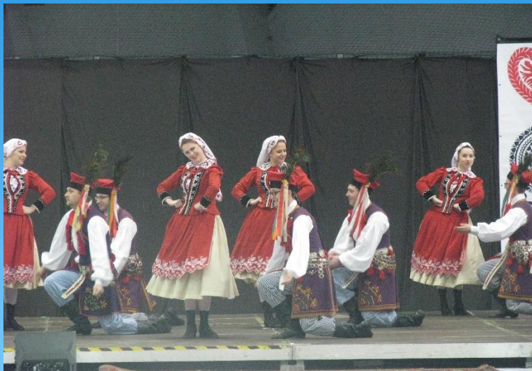
Krakowiak w wykonaniu Zespołu „Łódź”