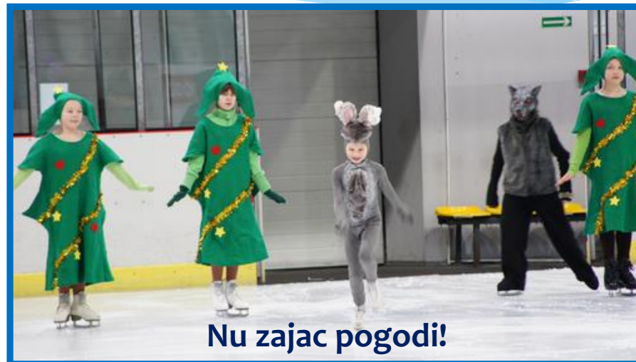
Nu zając pogodi!