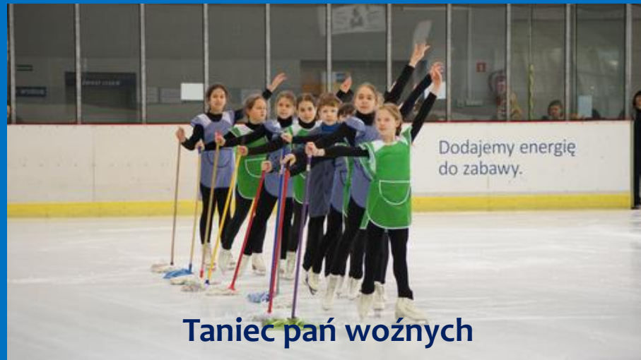
Taniec pań woźnych