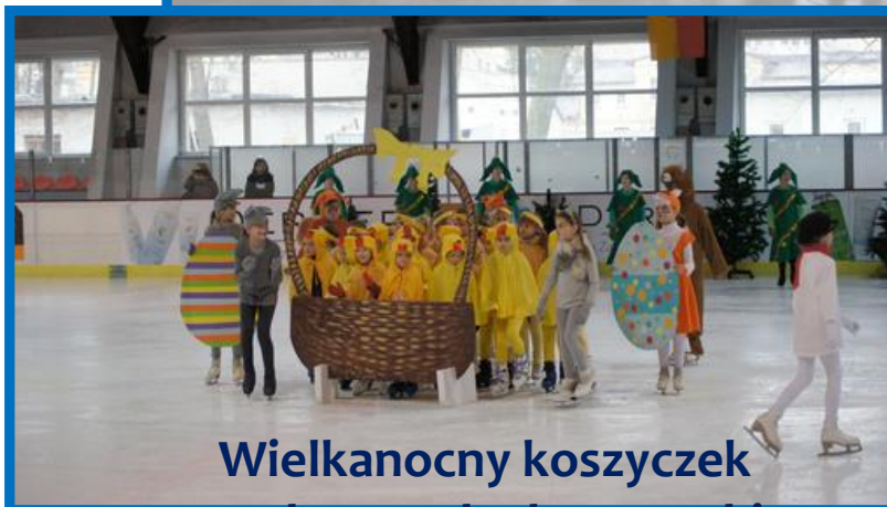
Wielkanocny koszyczek a w koszyczku kurczaczki z Przedszkola 122 i 153