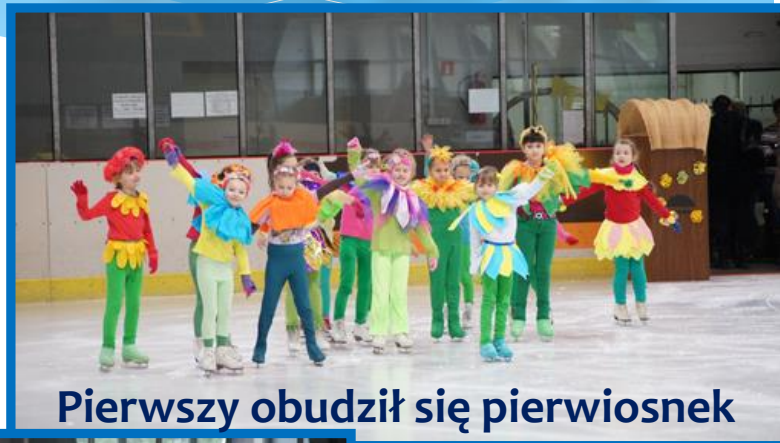
Pierwszy obudził się wiosienek