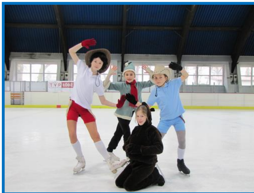
Bolek i Lolek na Dzikim Zachodzie Miś Uszatek Piaskowy Dziadek